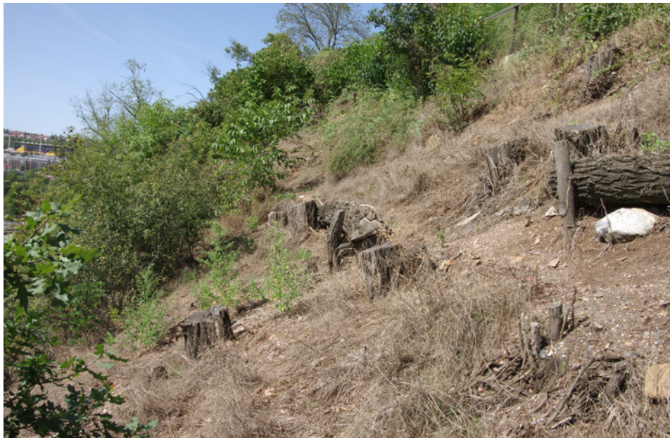
Vhodně provedený management v rámci východní části plochy 1 (26. 8. 2015) Properly executed management within the eastern part of area 1 (26. 8. 2015)