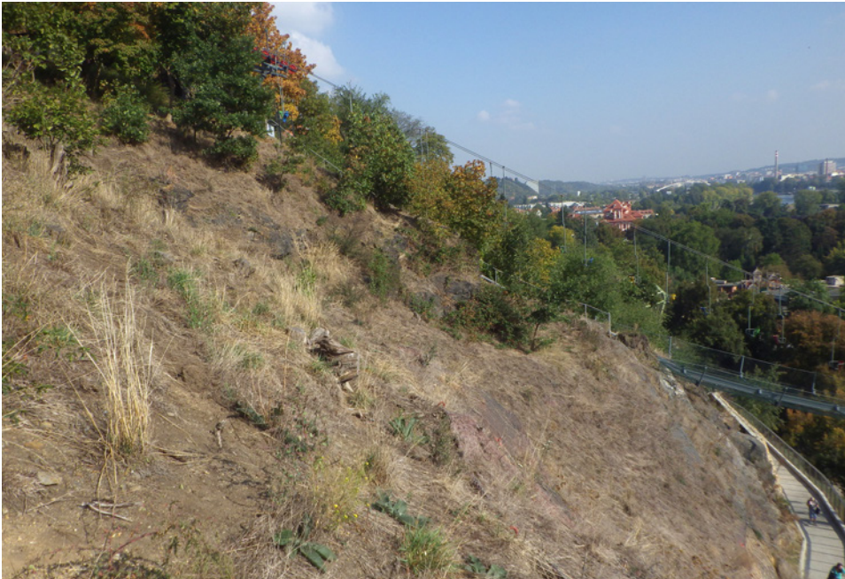
Střední část plochy 1 (5. 10. 2015). Z pohledu ještěrek jedna z nejatraktivnějších partií zoo Middle of area 1 (5. 10. 2015). From the view of lizards, one of the most attractive areas of the zoo