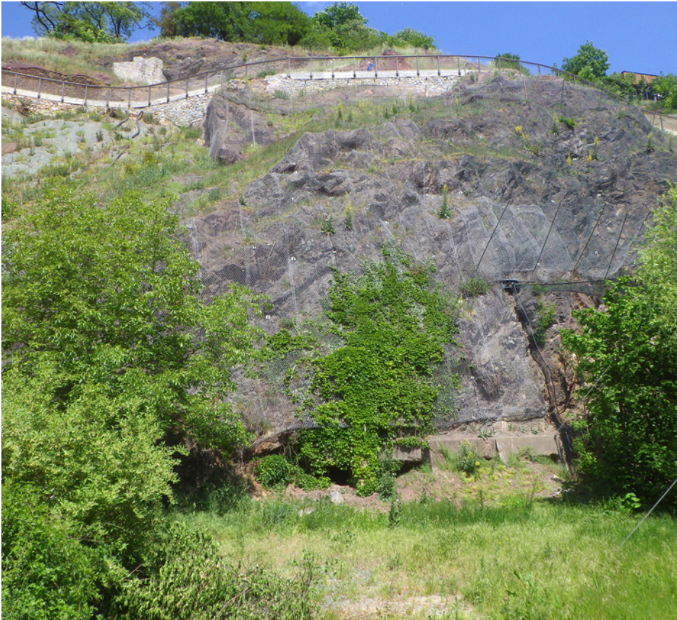
Charakter plochy 5 (18. 5. 2015) Appearance of area 5 (18. 5. 2015)