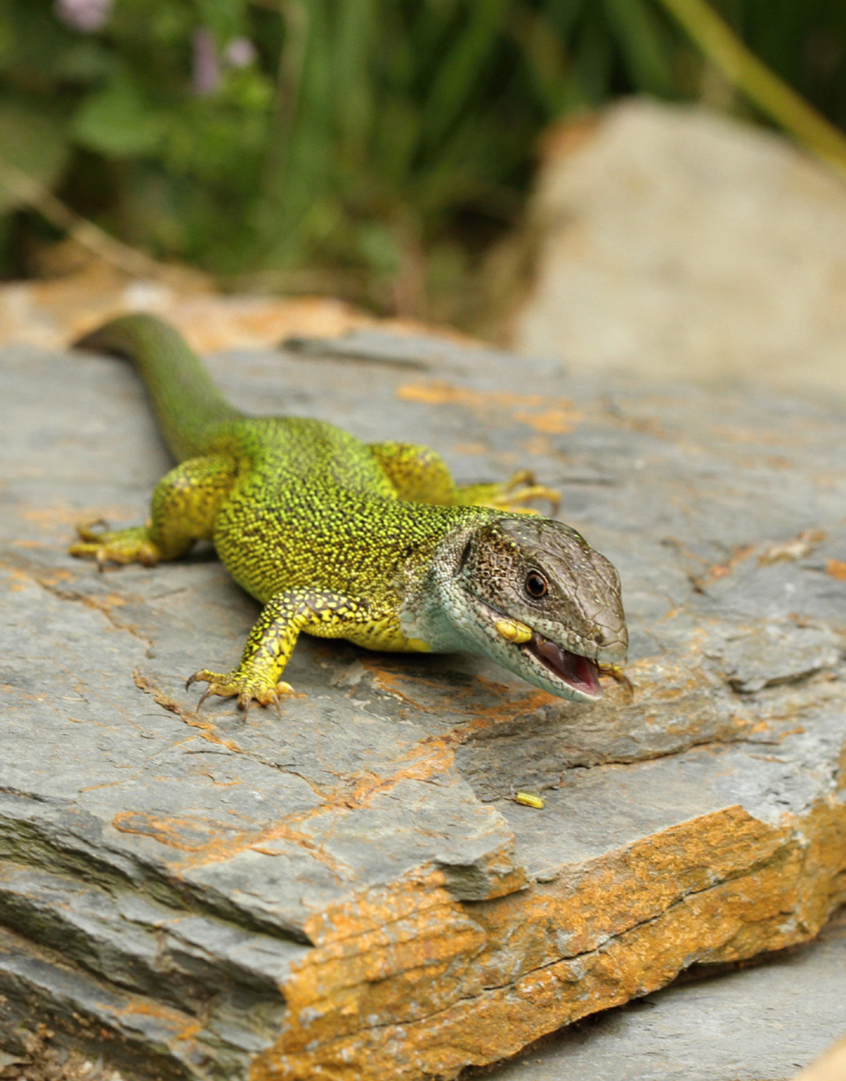
Ještěrka zelená ulovivší saranče (plocha č. 5) European green lizard hunting grasshopper (area No. 5)