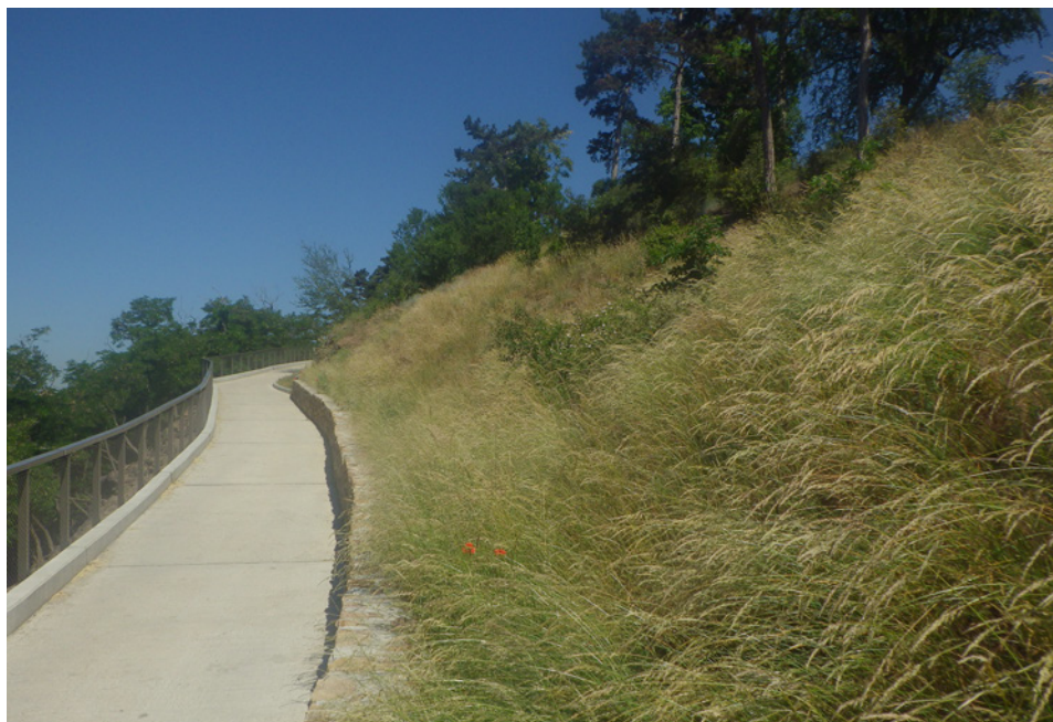
Severozápadní část plochy 1 (5. 6. 2015) Northwest part of area 1 (5. 6. 2015)