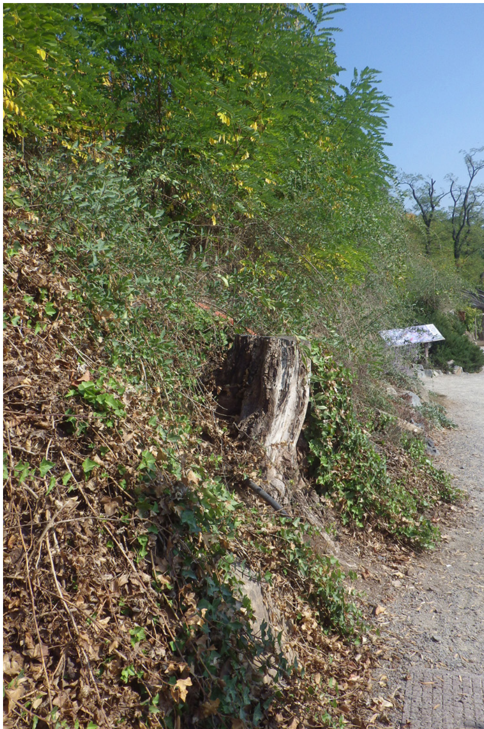
Charakter plochy 3 (5. 10. 2015) Appearance of area 3 (5. 10. 2015)