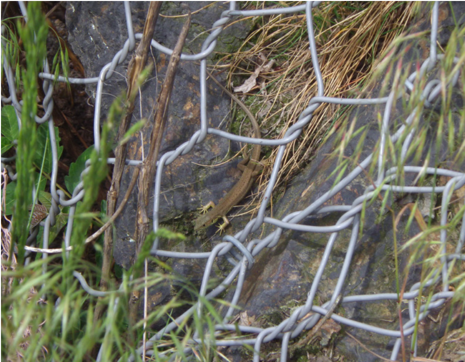
0++ jedinec, využívající skalní výchoz překrytý drátěnou sítí – plocha 1 0 ++ individual using a rock outcrop covered by wire mesh – area 1