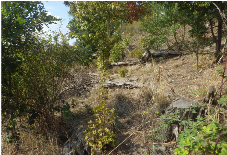
Střední část plochy 1 (5. 10. 2015). Z pohledu ještěrek jedna z nejatraktivnějších partií zoo Middle part of area 1 (5. 10. 2015). From the view of lizards, one of the most attractive areas of the zoo