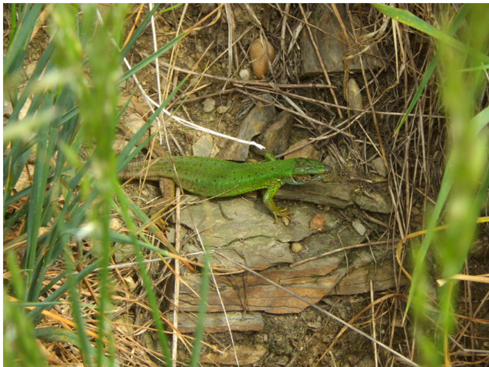
Adultní samice – plocha 1 Adult female – area 1