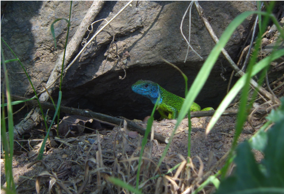
Adultní samec v době páření – plocha 1 Adult male at mating season – area 1