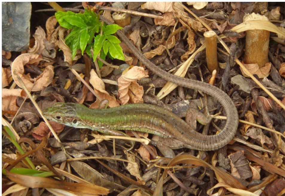
Subadultní samice – plocha 3 Subadult female – area 3

Kromě plochy 2, resp. 4, a plochy 1, kde byly na skalách pod lanovkou ještěrky pozorovány jako na jedné z posledních ploch před zahájením rozsáhlých managementových prací v roce 2011 (Pecina 1992) a pak až od roku 2014 (Rehák 2015), jsou záznamy výskytu ještětek v ostatních studijních plochách pravděpodobně prvními novodobými pozorováními jejich výskytu v těchto částech Zoo. Nízké počty pozorovaných jedinců v některých studijních plochách jsou ale přinejmenším překvapivé. Např. plocha 2, která je podle pozorování v minulosti považována za klíčovou pro existenci místní populace ještětek, kam byly již v minulosti cíleny managementové zásahy na podporu tohoto druhu (Pecina 1992, 1993, 1998) a ještě poměrně nedávno (kolem roku 2010) zde byly během jediného dne pozorovány desítky jedinců (např. Víta in verb. uvádí z roku 2010 jednorázové pozorování cca 25 adultních samců, z let 2009–2011 pak i pozorování více než 30 různých jedinců). V roce 2015 zde byla ale ještěrka zastřižena pouze 2 x (adultní samice, 0++ jedinec).