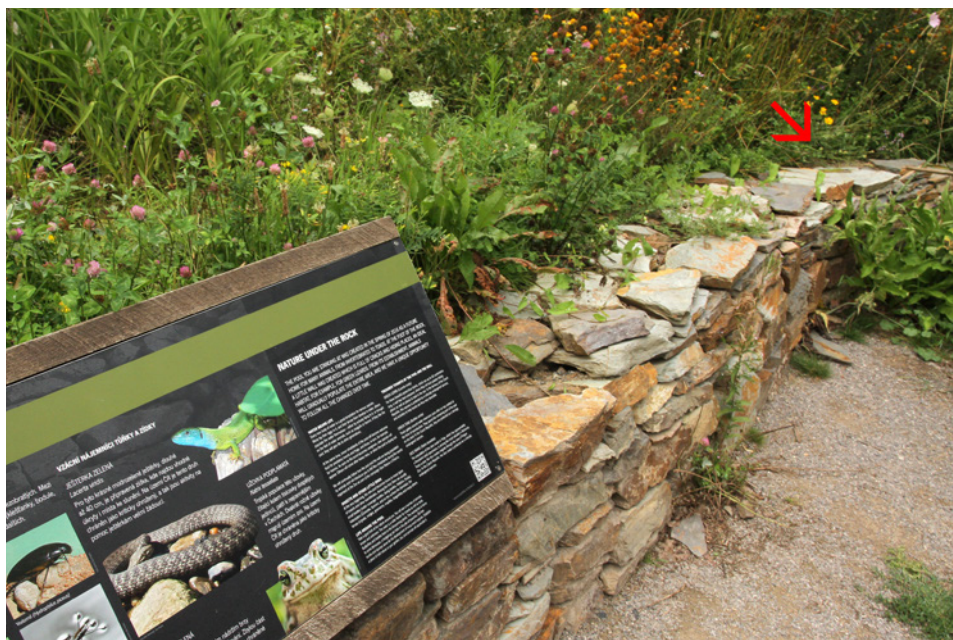
Ještětka zelená (označená šipkou) vyhřívající se poblíž informačního panelu na ploše č. 5 European green lizard (indicated by the arrow) basking close to the information panel at the area No. 5

Rušení ze strany návštěvníků a usmrcování jedinců pohybující se technikou: Jedná se o jevy, jejichž celkové dopady na místní populaci ještětky zelené jsou s největší pravděpodobností zcela marginální. Ještětky běžně využívají ke slunění plochy v bezprostřední blízkosti frekventovaných návštěvnických tras. Nelze vyloučit, že přítomnost návštěvníků, plynule proudících po vyhrazených plochách, by mohla mít i antipredační význam, a že ještětky tuto okolnost pozitivně vnímají. Nebezpečí jejich usmrcování obslužnou technikou považujeme vzhledem k rychlosti pohybu za minimální (na rozdíl od jiných druhů, jako jsou např. obojživelníci nebo juvenilní stadia užovek podplamatých, jejichž usmrcování projíždějící technikou bylo v areálu zahrady potvrzeno). Nelze vyloučit náhodné usmrcení ještětky při kosení porostů pomocí motorových sekaček či motorových kos (v roce 2015 bylo takto v ploše 4 zaznamenáno např. usmrcení užovky hladké).