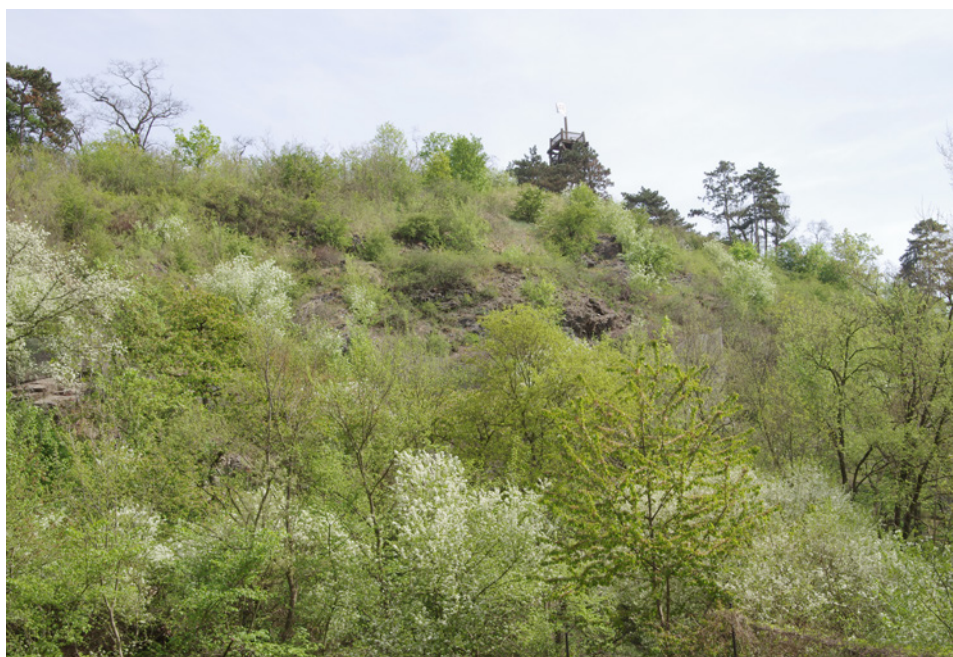
Pohled na zarůstající jižně exponovaný svah v rámci plochy 2 (27. 4. 2015)

Snížení atraktivity biotopu: V několika případech byl zaznamenán stav, kdy způsob údržby některých ploch nekoresponduje s ekologickými nároky ještěrek. Jako příklad lze uvést např. situaci zameranou v rámci studijní plochy 5, která patřila v jarním období 2015 k částem lokality, kde byla