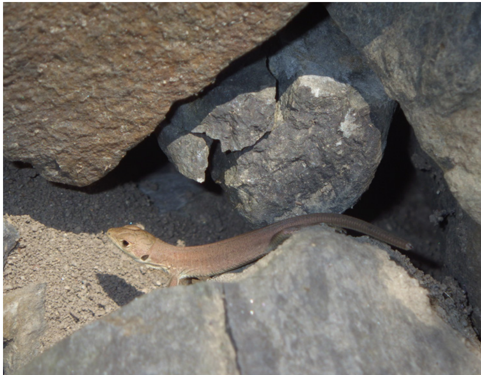
0+ jedinec využívající umělou skládanou zidku – plocha 6 0+ individual using artificial wall of stacked stones – area 6