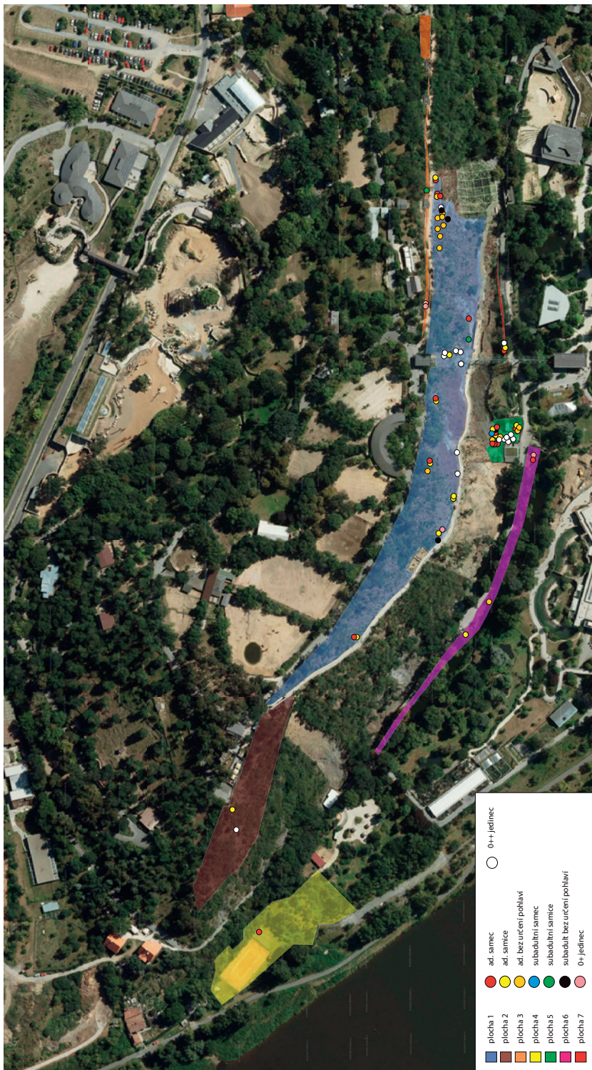
Mapa 1: Lokalizace a frekvence nálezů ještěřek zelených v rámci monitoringu provedeného v průběhu roku 2015 – souhrnné výsledky ze všech provedených návštěv. Mapový podklad: www.mapy.cz

Map 1: Localization and frequency of Green Lizard findings during the 2015 monitoring - aggregate results from all visits made. Map background: www.mapy.cz