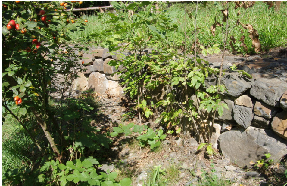
Skládaná zídka s vysokou atraktivitou pro ještěrky – plocha 6 (26. 8. 2015) Wall composed of stacked stones highly attractive for lizards – Area 6 (26. 8. 2015)