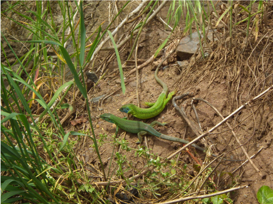
Pár při námluvách – plocha 5 Couple at courtship – area 5